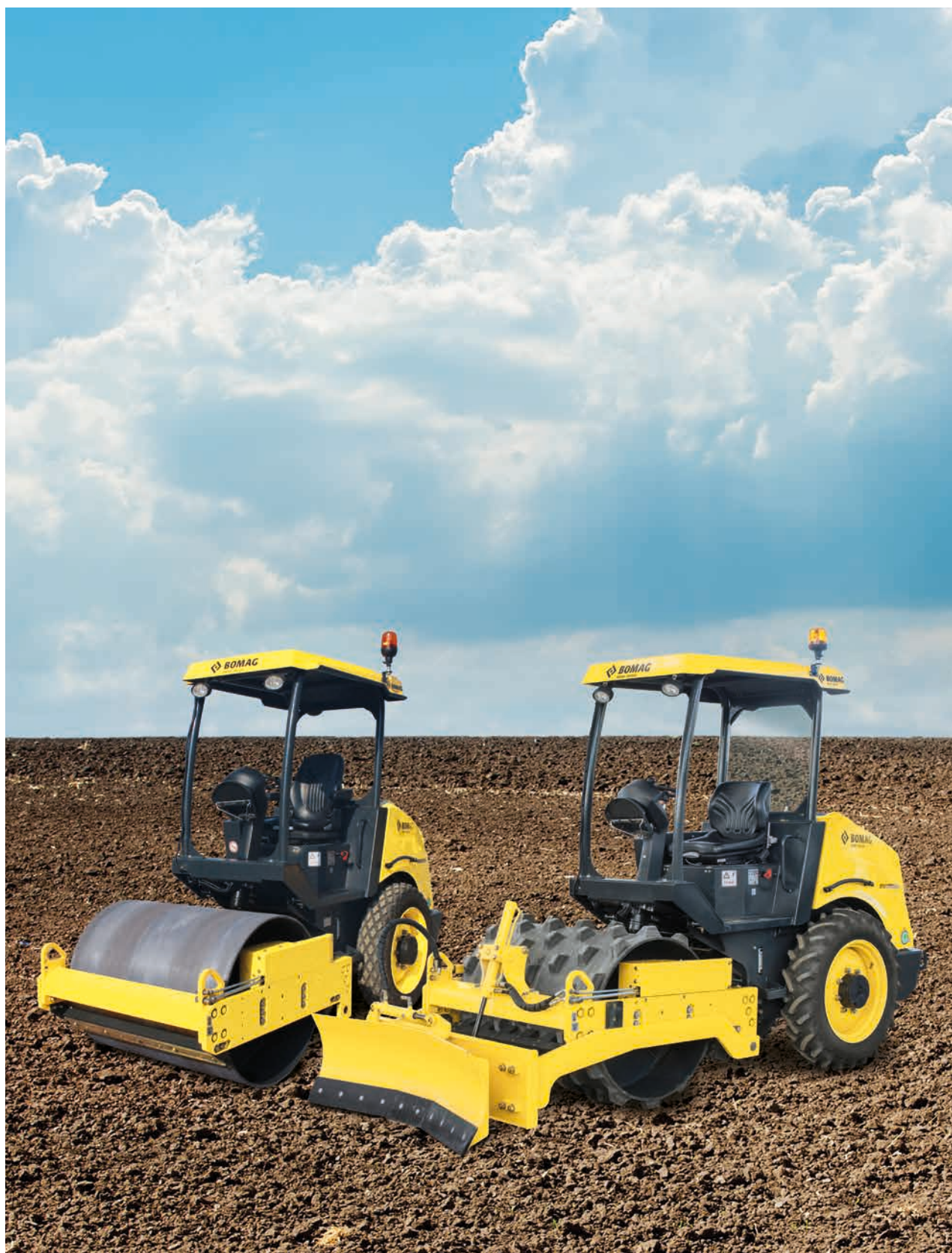
BW 124 DH-5 (cylindre lisse), BW 124 PDH-5 (cylindre dameur).

ULTRA MANIABLE ET PRÊT À RELEVER TOUS LES DÉFIS.